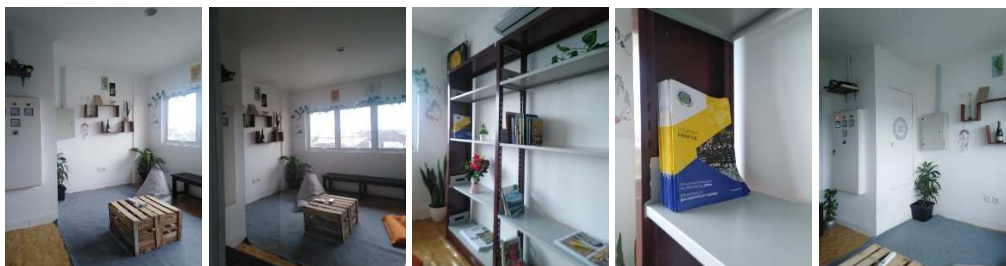
Gambar 3. Ruang Kreatif sesudah Diredekorasi

Berikut adalah beberapa gambar setelah ruang kreatif dipercantik dan ditata sedemikian rupa agar lebih menyenangkan dan nyaman.