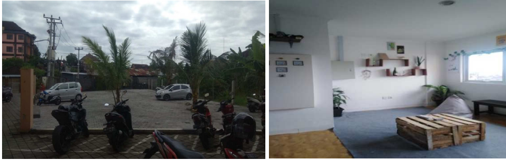
Gambar 1. Parking Area dan Creative Room

The Griya SPB sekarang juga menyediakan set up honeymoon, jadi kalian yang ingin menghabiskan waktu dengan pasangan sangat bisa sekali untuk menginap di griya spb