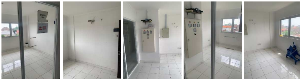
Gambar 2. Ruang Kreatif sebelum Didekorasi

Dan di bawah ini adalah beberapa gambar sebelum creative room di The Griya SPB dibuat lebih baik adaptif untuk digunakan sebagai ruang kreatif bagi para penghuni di The Griya SPB.